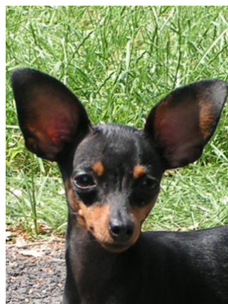
Je libo krysaříka komického nebo raději hezkého?